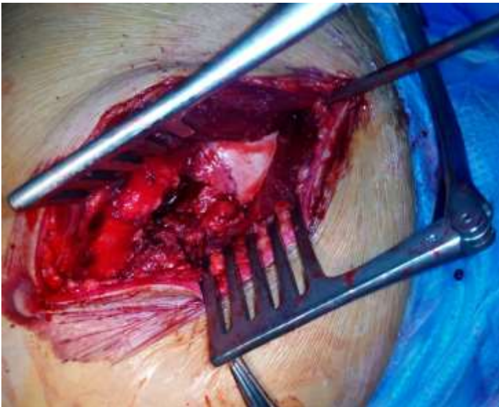
Figure 3: image peropératoire-désinsertion capsulo-labrale