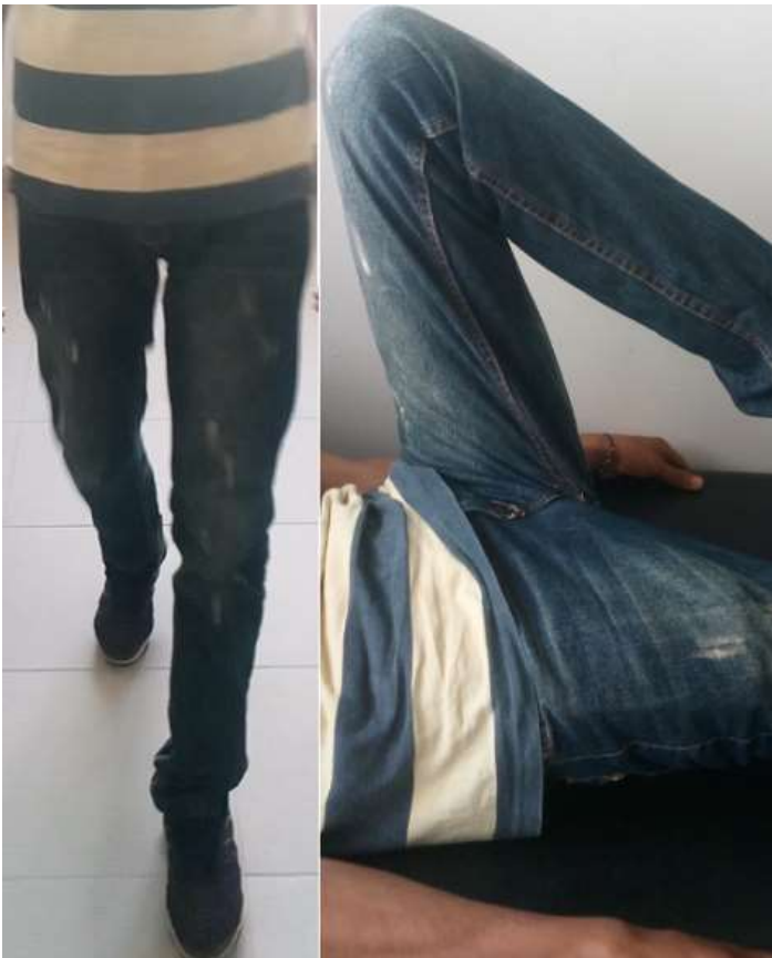
Figure 5 : images cliniques-résultats fonctionnels