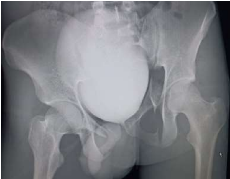
Figure 4 : radiographie du bassin de face-réduction de la luxation