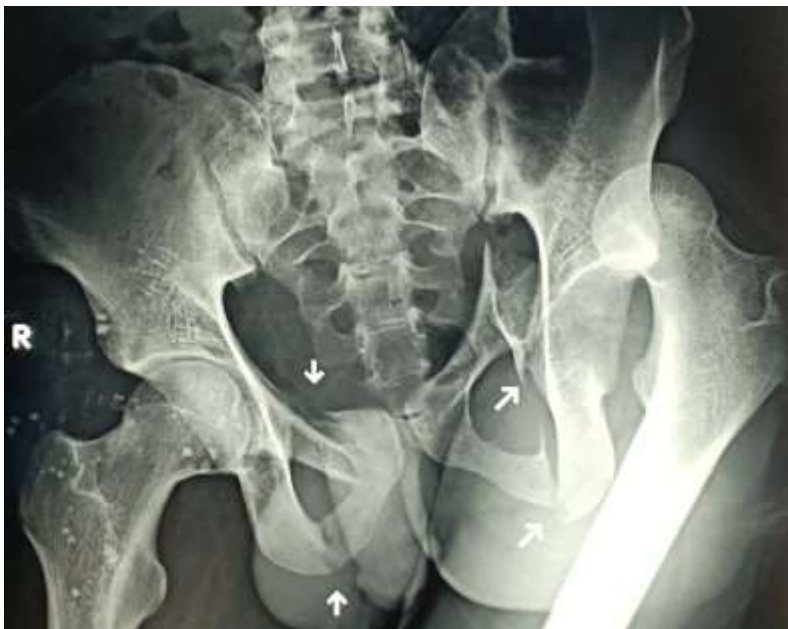
Figure 1: radiographie du bassin de face-luxation de la hanche gauche